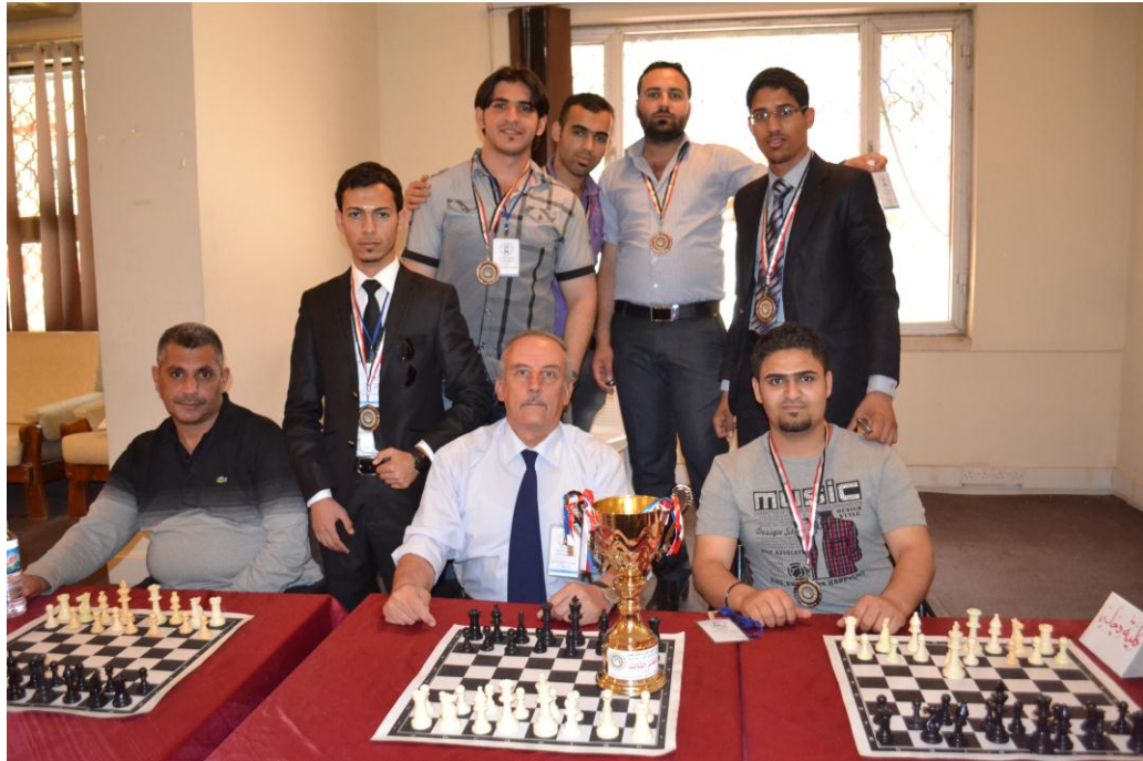
منتخب الشطرنج حصل على المركز الثالث في بطولة المنطقة الوسطى