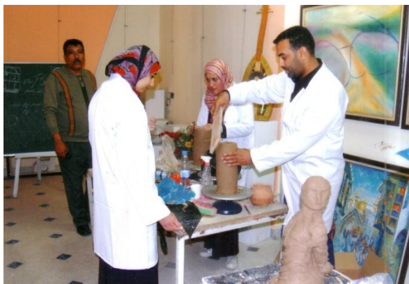
جانب من دورة السيراميك