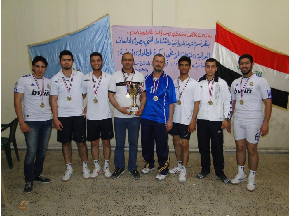
منتخب تنس الطاولة حصل على المركز الاول في بطولة المنطقة الوسطى