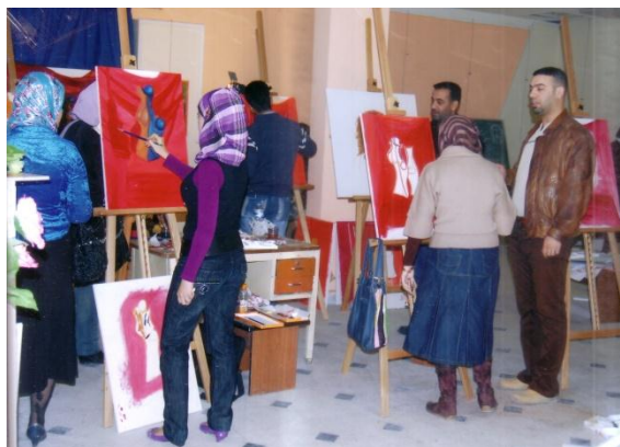
جانب من دورة الرسم