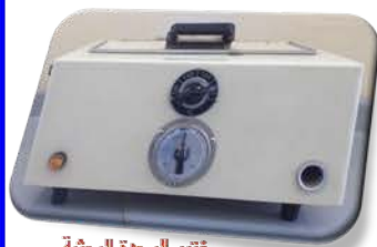
مختبر الوحدة البحثية

Heat Transfer Container . Used for controlled heating and cooling of different materials.