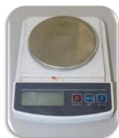
مختبر الكيمياء العامة

وهو ذو مناشئ مختلفة : كوري - الماني - كندي - صيني - هنكاري - امريكي.