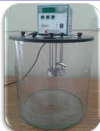
مختبر الكيمياء الفيزيائية

حمام مائي زجاجي ذو مسيطر تنوير حراري غطاس. يستخدم لقياس اللزوجة الحركية بدرجة حرارة ثابتة مسيطر عليها رقميا. وفقا للمواصفة الامريكية