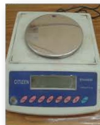
مختبر الكيمياء الفيزيائية