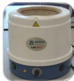
مختبر الكيمياء العامة