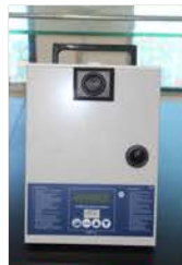
مختبر الكيمياء العامة

Used for determining the melting point of solid substances.