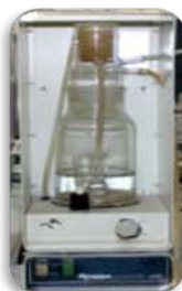
مختبر العمليات الصناعية