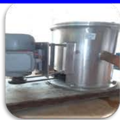
مختبر المعمل التجريبي

Used to determine the cake resistance and the residence time.