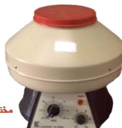
مختبر التخليق الالي

Made: Gemmy Industrial Corp. Taiwan /2011 Item No. : 902632