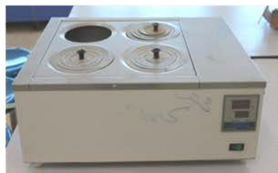
مختبر الكيمياء العامة

Thermostatic Water Bath Used as constant temperature medium to perform any process at this temperature.