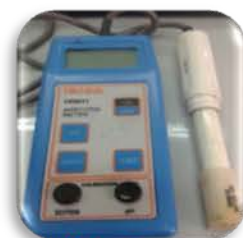
مختبر التحليل الآلي

Total Dissolved Salts analyzer Determination of total dissolved salts in water.