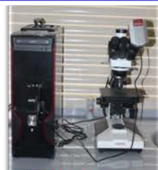
مختبر الوحدة البحثية

Microscope with camera. Used for testing and getting a picture for metal and plastic specimens by camera with magnification power of 1600x zooming lenses.