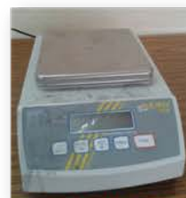
مختبر الكيمياء الفيزيائية

Made: Denver/Germany/2005 Item No. : 23411092