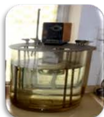
مختبر الوقود والتصفية

Used for heating of petroleum products to measure their viscosities at different temperatures .