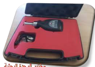
مختبر الوحدة البحثية

Used to measure the hardness of polymeric material .