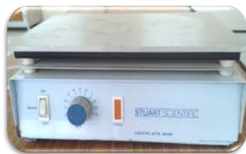
مختبر الكيمياء الفيزيائية