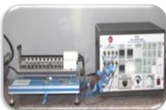
مختبر المعمل التجريبي

Used to study the effect of cross-sectional shape of the tube and type of metal on the rate of heat transfer.