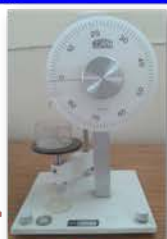
مختبر الكيمياء الفيزيائية