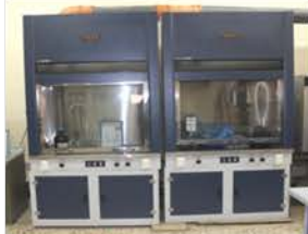
مختبر العمليات الصناعية

Used for processes evolve harmful gases or vapors.