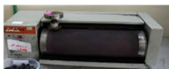
جهاز القشط /مختبر تكنولوجيا المواد

To measure the weight loss of rubber due to abrasion when subjected to different loads.