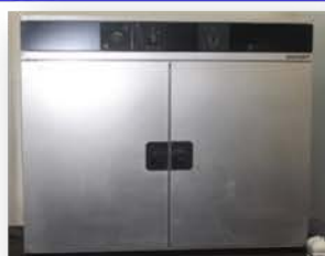
مختبر العمليات الصناعية

Used for biochemical processes between (25 -70) °C .