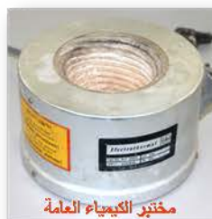
مختبر الكيمياء العامة