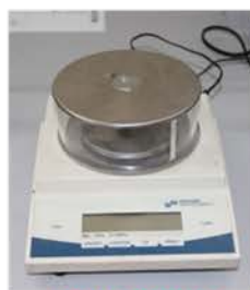
مختبر تكنولوجيا المواد

Made: Denver/Germany/2008 Item No. : TP-303