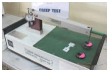
مختبر تكنولوجيا المواد

Made: GUNT /Germany/2013 Item No. : 211091