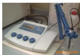
مختبر التحليل الآلي

Conductivity Meter Used for determining the conductivity of the electrolytic solutions. Made: Germany /2007 Item No. : 610507089007 Model: DDS-307