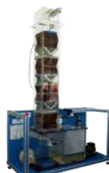
مختبر المعمل التجريبي

Bench Top Cooling Tower. Used to obtain the required design data of cooling tower . Made: Spain /EDIBON/2011 Item No. : TTEB 0003/10