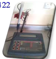
مختبر الدراسات العليا