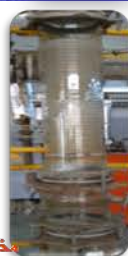
مختبر المعمل التجريبي

Tube Coil Heat Exchanger. Used to perform heat exchange experiments between steam and water to establish the relationship between water flow rate and overall heat transfer coefficient.