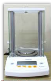
مختبر الكيمياء الفيزيائية

Made: Germany/sartorius/2013 Item No. : 18565