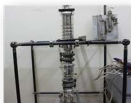
مختبر العمليات الصناعية