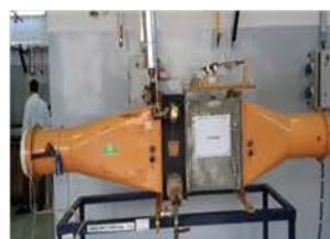
مختبر المعمل التجريبي

Used to study the drying process of wet solid by hot air and to determine the overall heat transfer coefficient between air and steam.