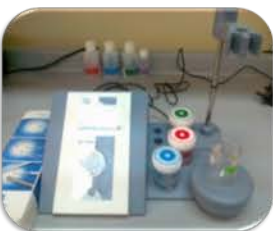
مختبر التحليل الآلي

pH and Ion-Meter GLP 22 Used for determining of ions concentration in water and eq. solutions. Cl^- , NO_3^- , F^- , CN^- , NH_4^+