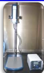
مختبر العمليات الصناعية

Laboratory Mixer Used for mixing liquids under high speeds to be homogenous .