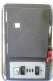
مختبر التحليل الآلي

يستخدم في تجفيف الأدوات الزجاجية و المواد الرطبة لتخليصها من الرطوبة بدرجات حرارة ما بين ٥٠ - ٥٠٠ °م المنشأ: الماني، جيكي