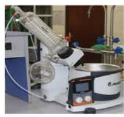
مختبر العمليات الصناعية

Rotary Evaporator Used for distilling of volatile solvents under low pressure.