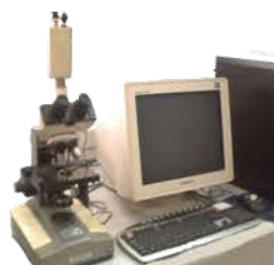
مختبر الوحدة البحثية / الأغشية

High Quality Biological Microscope Used for detecting of microbiological creatures with magnification power of 100 to 1000.