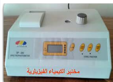
مختبر الكيمياء الفيزيائية

Uv. – Visible Spectrophotometer Used for determining the concentrations of mixtures from the fraction of radiation absorbed by the mixture species.