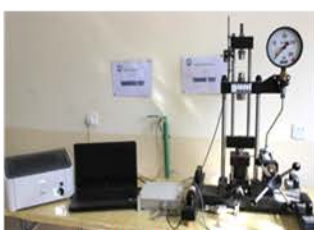
مختبر تكنولوجيا المواد

Universal Testing Machine . To determine deferent mechanical properties such as tensile, bending and hardness. Made: GUNT /Germany /2011 Item No. : 500941004052