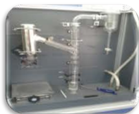
مختبر الوقود والتصفية

Used for Distillation of crude oil and that remains from the atmospheric distillation process at reduce pressure.