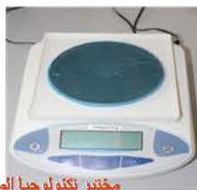
مختبر تكنولوجيا المواد

Made: Germany/kern/2011 Item No. : WD080027488