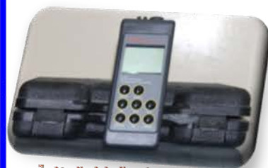
مختبر العمليات الصناعية

Precision Conductivity/TDS Meter Used for determining the conductivity of the electrolytic solutions and total dissolved salts.