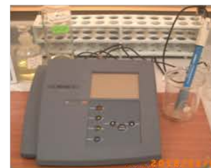
مختبر التحليل الآلي