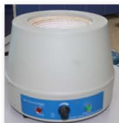
مختبر العمليات الصناعية