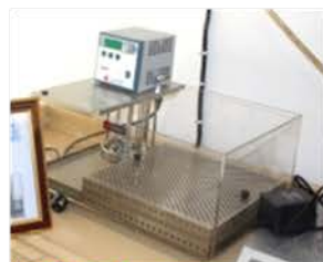
مختبر الوقود والتصفية

Used to measure the penetration of wax and asphalt material.