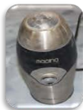
مختبر العمليات الصناعية

Laboratory Mill Used for fine grinding of small quantities of solid materials.