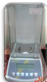
مختبر التحليل الالي

Made: Denver/Germany/2008 Item No. : TP-303