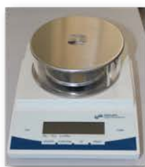
مختبر الكيمياء العامة

Made: Korea/ANB Gulf /2003 Item No. : HL-200