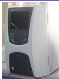
مختبر التحليل الآلي

Carbone (TOC) Analyzer. Used to determine total carbon (TC), carbon in inorganic compounds (IC) & total carbon in organic compounds (TOC). Made: SHIMADZU / JAPAN /2013 Item No. : H54425100095