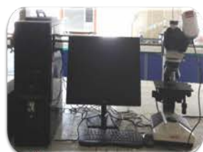
مختبر الوحدة البحثية

Microscope with Camera Used for testing and getting a picture for met- als surfaces by camera with four different lenses.