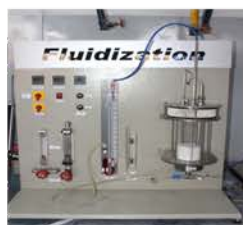
مختبر المعمل التجريبي

Used to study fluidization process under isothermal and heat transfer conditions and to study the effect of air flow on particles behavior.