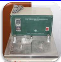
مختبر الوقود والتصفية

Used to measure the vapor pressure of light petroleum products.