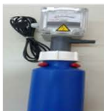
مختبر التحليل الآلي

Water Deionization Unit Used to produce deionized water Made: Spain/Raypa /2013 Item No. : 4182