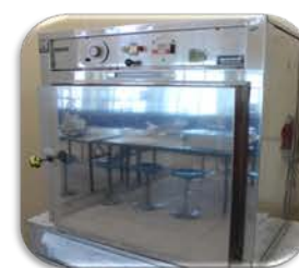
مختبر الكيمياء العامة