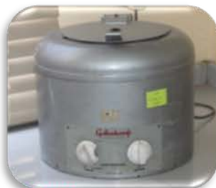
مختبر العمليات الصناعية

Made: England /old product. Item No. : 6P73G