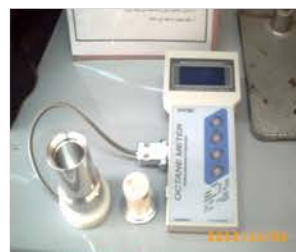
مختبر التحليل الآلي

Octane Meter. Used for measuring octane and cetane numbers of gasoline and diesel fuel. Made: SHATOX/ Austria/2011 Item No. : 3193