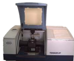
مختبر التحليل الآلي

Fourier Transform Infrared Spectrophotometer Used for quantitative and qualitative analysis of liquids and solids within frequency range of (600 - 4000 cm^{-1} ). Made: BRUKER/Germany/2011 Item No. : SU.7.430.644