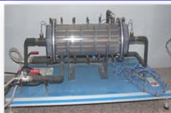
مختبر المعمل التجريبي

Used to apply Reynolds analogy to calculate heat transfer coefficient using simple and modified Reynolds number.