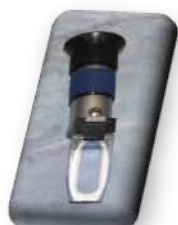
مختبر العمليات الصناعية

Precision Hand Refractometer Used for determining of %sugar in aqueous solutions. (Degree Brix).