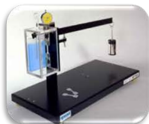
مختبر تكنولوجيا المواد