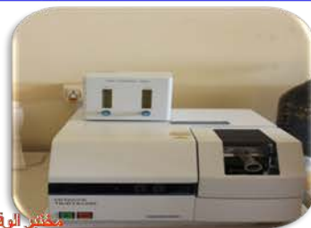
مختبر الوقود والتصفية

Used to determine the percentage of sulfur in petroleum products.