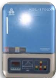
مختبر تكنولوجيا المواد