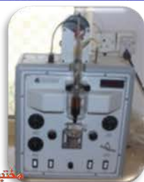
مختبر الوقود والتصفية

Made: USA /Koehler/2011 Item No. : R60540109