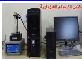
مختبر الكيمياء الفيزيائية