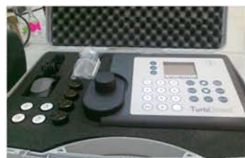
مختبر التحليل الآلي

Portable Turbidity Meter Used for determine turbidity of water within the range of ( 0.01 to 1100 NTU). Made: Lovibond/Germany/2013 Item No. : 13/201