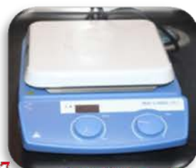
مختبر العمليات الصناعية