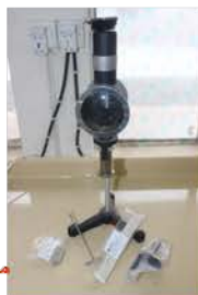
مختبر الوقود والتصفية

Made: USA /Koehler/2013 Item No. : K270-4P