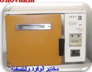
مختبر الوقود والتصفية