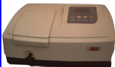
مختبر الوحدة البحثية

Ultraviolet and Visible Absorption Spectrophotometer. Used for determining the concentrations of liquid mixtures from the fraction of radiation absorbed by the mixture species Made: CTrom Tec/UV-1100/ China/2009 Item No. : UEB0809025