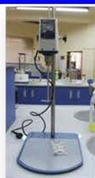
مختبر العمليات الصناعية

Laboratory Mixer Used for mixing of liquids under low speeds.