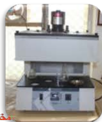
مختبر الوقود والتصفية

Made: USA /Koehler/2011 Item No. : R03182111-N