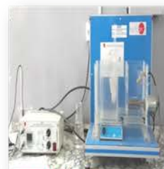
مختبر المعمل التجريبي

Liquid-Liquid Diffusion. Used to determine the diffusivity of salt solution. Made: Spain /EDIBON/2011 Item No. : QDTL 0008/10