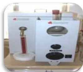
مختبر الوقود والتصفية

ASTM - Distillation. Used for distillation of the light cuts of petroleum under atmospheric pressure .