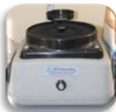
مختبر الوحدة البحثية

Grinding Wheel & Polishing Machine . Used for surface polishing of metals by emery paper fixed on rotary disk.