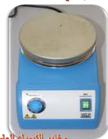
مختبر الكيمياء العامة