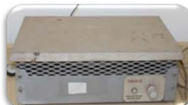
مختبر الوقود والتصفية