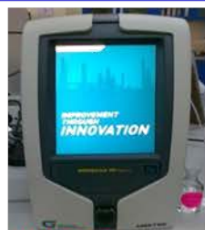
مختبر التحليل الآلي

MINISCAN IRXpert Used to analyze the components of gasoline, diesel and biofuel blends). Made: GmbH/Australia/2013 Item No. : 26-501-0081