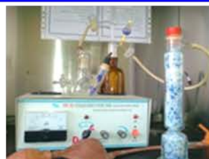
مختبر التحليل الآلي

Petroleum Products Water Content Used for determining water content of petroleum products.