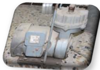
مختبر العمليات الصناعية

Used for air removing from closed chamber .