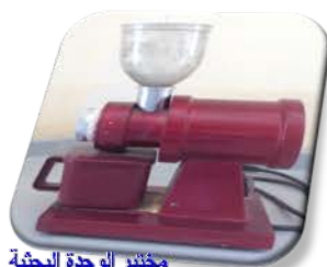
مختبر الوحدة البحثية

Used for grinding of materials and convert them to small size particles .