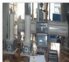
مختبر المعمل التجريبي

Conductive Heat Transfer under Steady State. To prove the dependence thermal conductivity on type of material & temperature, and to confirm Fourir's law for heat conduction in solids. Made: USA /LIND BERG /2008 Item No. : *****