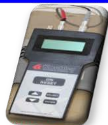
مختبر الوقود والتصفية

Used to measure the percentage of salt in crude oil.