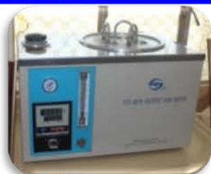
مختبر الوقود والتصفية

Made: China/ Geological instruction co.ltd./2008 Item No. : 08-5