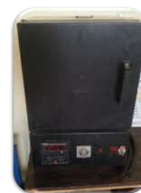
مختبر الدراسات العليا