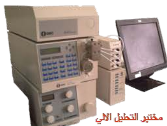
مختبر التحليل الآلي

High Performance Liquid Chromatography (HPLC). Used for quantitative & qualitative analysis of liquids by C18 column. Made: GBC/Australia/2012 Item No. : L2075