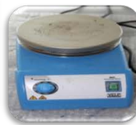
مختبر الوقود والتصفية