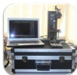
مختبر الوحدة البحثية

Used to measure the contact angle of liquid drop with solid surface and to deduce whether it is hydrophobic or hydrophilic.