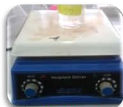
مختبر التحليل الالي