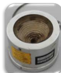
مختبر الوقود والتصفية

Made: China/Talsite instrument Co.Ltd. /2007