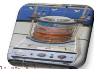
مختبر الوحدة البحثية

Used to determine the specifications of solid particles.