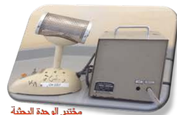
مختبر الوحدة البحثية