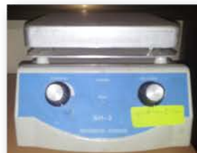
مختبر الدراسات العليا