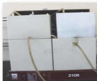
مختبر الكيمياء العامة

Made: Germany/GFL /2008 Item No. : 102767021