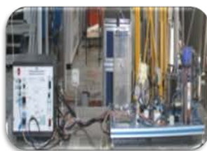
مختبر المعمل التجريبي

Used to study filtration process under constant pressure or constant filtrate rate and to determine the specific resistance of the cake.