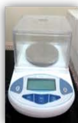
مختبر التحليل الالي