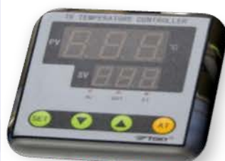
مختبر العمليات الصناعية

Digital Temperature Controller Used for temperature control .