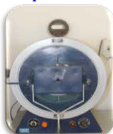
مختبر الوقود والتصفية