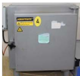
مختبر تكنولوجيا المواد