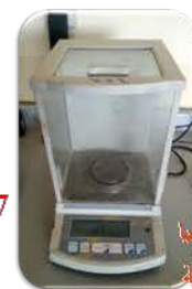
مختبر الدراسات العليا مختبر الوحدة البحثية

Made: KERN/ Germany/2007 Item No. : ALS 220-4