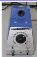
مختبر الكيمياء العامة

يستخدم في إيجاد درجة انصهار المواد الكيميائية الصلبة كخاصية من خواص المواد.