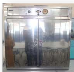
مختبر تكنولوجيا المواد