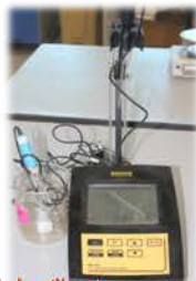
مختبر الكيمياء العامة