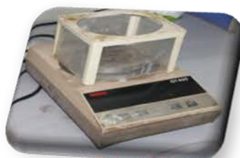
مختبر الصناعات الصغرية

Made: Germany/sartorius/2013 Item No. : 18565