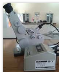
مختبر الكيمياء الفيزيائية