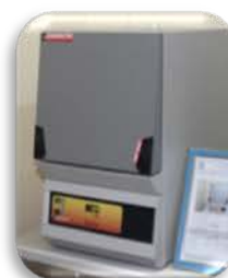
مختبر العمليات الصناعية