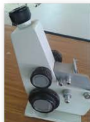
مختبر الكيمياء الفيزيائية