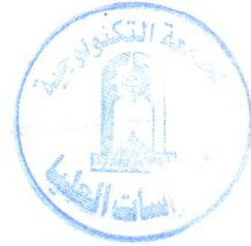
أ.د. أمين دواي ثامر رئيس الجامعة

تقرر منحه درجة ماجستير علوم في الهندسة الكهربائية / تخصص هندسة قدرة وبتقدير ( جيد جداً ) مع تمتعه بكافة الحقوق والامتيازات التي تخوله اياه هذه الدرجة.