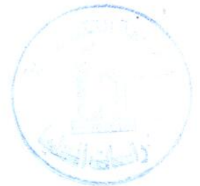
أ.د. أمين دواي ثامر رئيس الجامعة

تقرر منحها درجة ماجستير علوم في هندسة البناء والانشاءات / تخصص هندسة جيوماتيك وبتقدير ( جيد ) مع تمتعها بكافة الحقوق والامتيازات التي تخولها إياه هذه الدرجة.